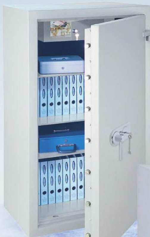
Diamant Fire 130 IT mit Doppelbart-Hochsicherheitsschloss / with high security double bitted key lock EN 1300 Class A

SAFES LESS THAN 1000 KG MUST BE ANCHORED INTO A CONCRETE FLOOR.