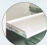
Teleskop-Fachboden Telescopic shelves to pull out