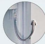
EMA-Vorbereitung EMA preparation

Alle Einteilungen sind ohne Innentresor. All divisions are without interior safes.