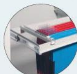
Teleskop-Hängeregister Telescopic filing frame for suspension