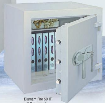
Diamant Fire 50 IT mit Doppelbart-Hochsicherheitsschloss / with high security double bitted key lock EN 1300 Class A