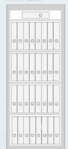
Diamant Fire PO_160 IT 33 Ordner / Folder