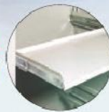
Teleskop-Fachboden Telescopic shelves to pull out