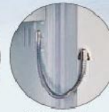
EMA-Vorbereitung EMA preparation

Alle Ordner-Einzelungen sind ohne Innentresor. All divisions are without interior safes.