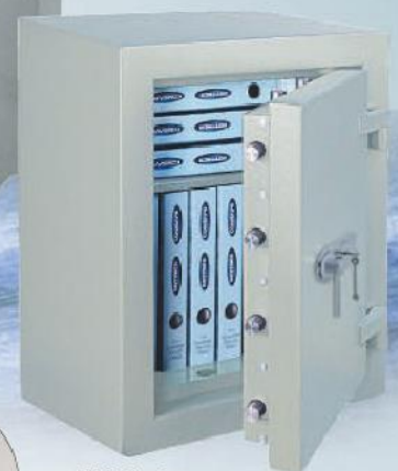
DO-60 Premium mit Doppelbart-Hochsicherheitsschloss / Double bitted high security lock with EN 1300 Class A