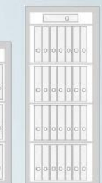
Diamant Super Fire DO_160 IT 29 Ordner / Folder