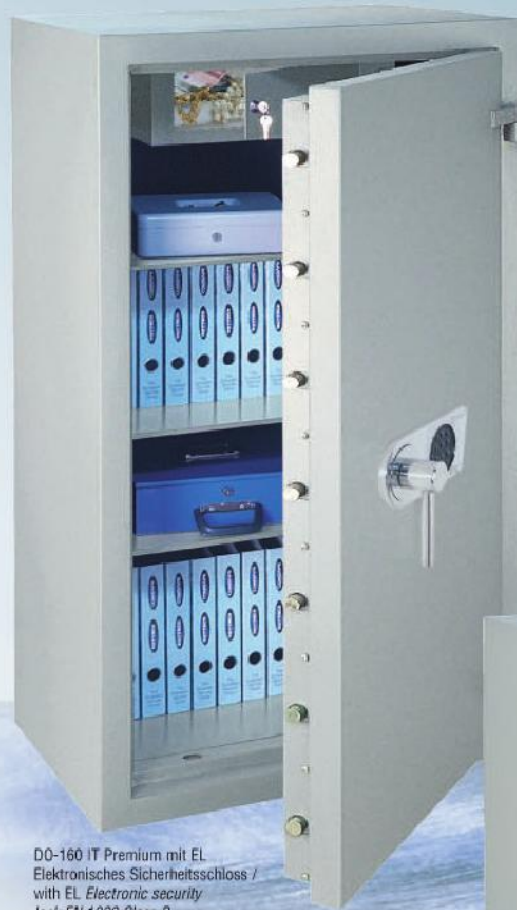
DO-160 IT Premium mit EL Elektronisches Sicherheitsschloss / with EL Electronic security lock EN 1300 Class B

SAFES LESS THAN 1000 KG MUST BE ANCHORED INTO A CONCRETE FLOOR.