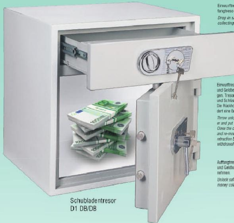
Schubladentresor D1 DB/DB

Comsafe-Geldeinwurf-Schubladen-System Comsafe Security Coin-DrawerSystem