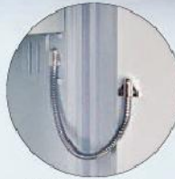
EMA-Vorbereitung EMA preparation