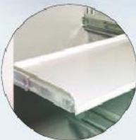
Teleskop-Fachboden Telescopic shelves to pull out