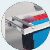
Teleskop-Hängeregister Telescopic filing frame for suspension