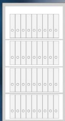
Samoa_160 36 Ordner / Folder