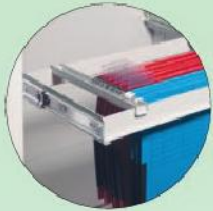
Teleskop-Hängeregister Telescopic filing frame for suspension