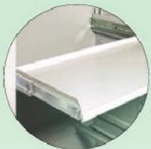
Teleskop-Fachboden Telescopic shelves to pull out