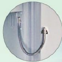
EMA-Vorbereitung EMA preparation